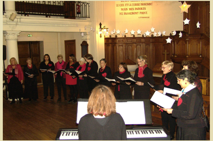
« Les mélomanes ont beaucoup apprécié le concert de Noël du chœur féminin Donne Cantabile » Samedi 16 décembre 2023