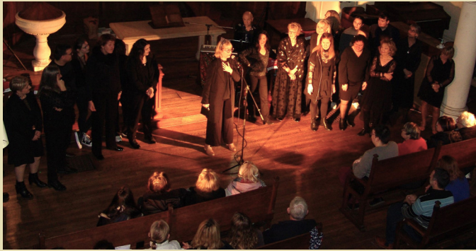
«150 personnes sont venues écouter La Ritournelle» Vendredi 15 décembre 2023