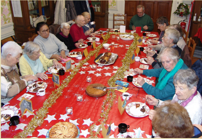
« Un goûter de l'Avent succulent » Jeudi 14 décembre 2023